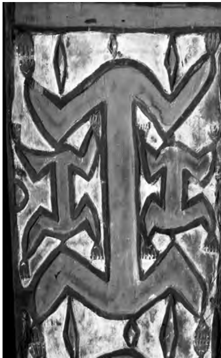
Detail asmatkého štítu zobrazuje předka. Asmaté podobně jako Marind-animové se věnovali lovu hlav kvůli iniciacím, získání prestiže a za účelem pomsty zabitých předků.

Při řešení otázek etiky terénního výzkumu se zpravidla teritoriální chování a vnitrodruhová konkurence pomíjí a soustředí se na otázky práce s lidmi, kteří se stali předmětem výzkumu. Ve standardních příručkách antropologie zpravidla najdeme konstatování, že delikátním a současně klíčovým úkolem je navázat vztah se skupinou lidí, která se má stát předmětem výzkumu, a získat si její důvěru. 23 Každý antropolog toho dosáhl jinak. 24 Pokud jste někdy sledovali dokument zachycující, jak se třeba lev pomalu přibližuje za lovnou zvěř, jedná se o podobně složitý a náročný úkol. Aby ji mohl skolit, nenápadně se plíží a nesmí se nechat ucítit , aby ji nevyplašil . Pokud je lov úspěšný, má k dispozici evolučně vzniklé nástroje, jimiž je schopen se efektivně dostat ke své stravě, s pomocí ostrých zubů a drápů rychle a snadno nasytí svou potřebu. Rovněž antropolog disponuje po „předcích“ zděděnými nástroji, jimiž se dostává k žádoucím informacím – etnografickým interview, zúčastněným pozorováním, genealogickou metodou aj. Již Johannes Fabian si povšiml, že celá koncepce terénního výzkumu a jeho technik se zakládá na snaze šetřit etnografův čas – jeho pobyt v terénu se musí vyznačovat