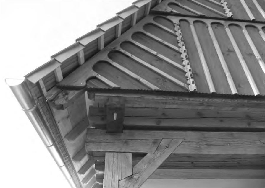
Nevhodné stavební prvky užívané na objektu lidového stavitelství v Podorlickém skanzenu v Krňovicích. 2011, foto D. Drápala.

tak vlastně vědomě prezentována nepravda a z etického hlediska by tyto moderní technologie i materiály měly být jasně přiznány a odlišeny od těch tradičních. Vědomá lež se totiž v institucích kulturněpaměťového typu stává velice problematickou a diskutabilní záležitostí. 3