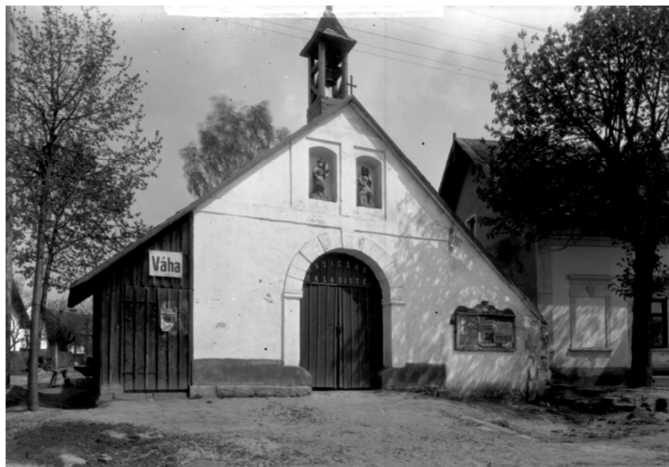
Ktová ( Semily ). Hasičská zbrojnice se zvoničkou. 1920–1925