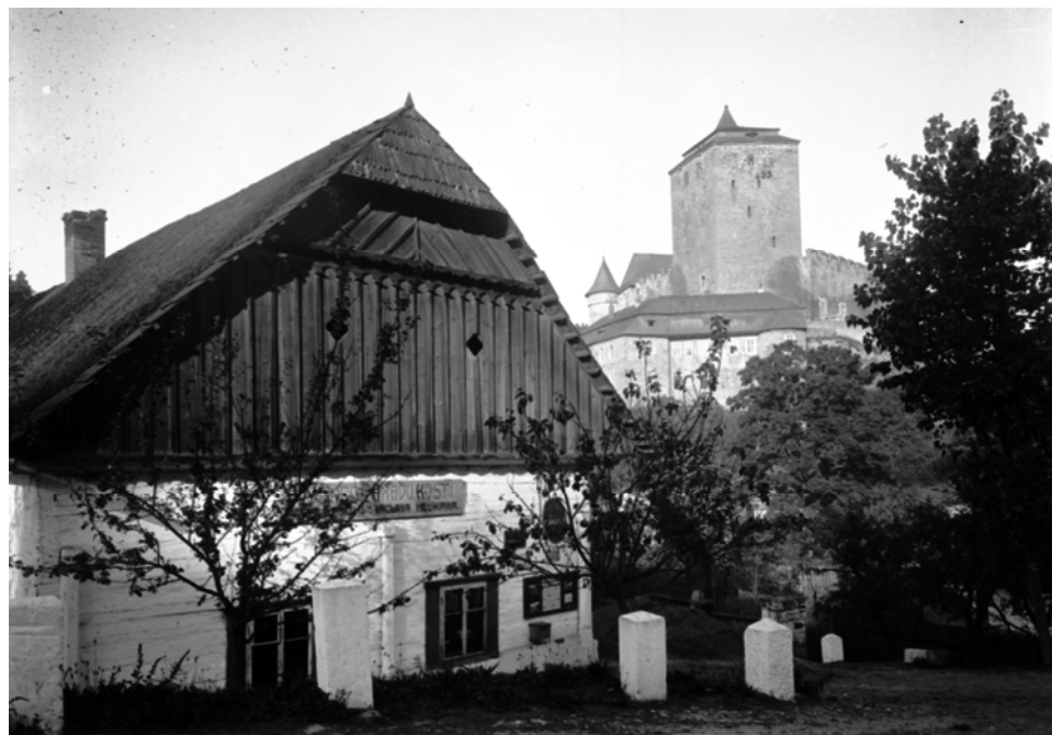
Podkost ( Semily ). Helikarova hospoda čp. 19.