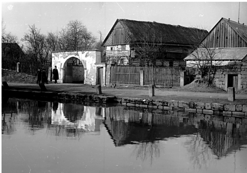
Pohoř u Turnova ( Semily ). Usedlost.