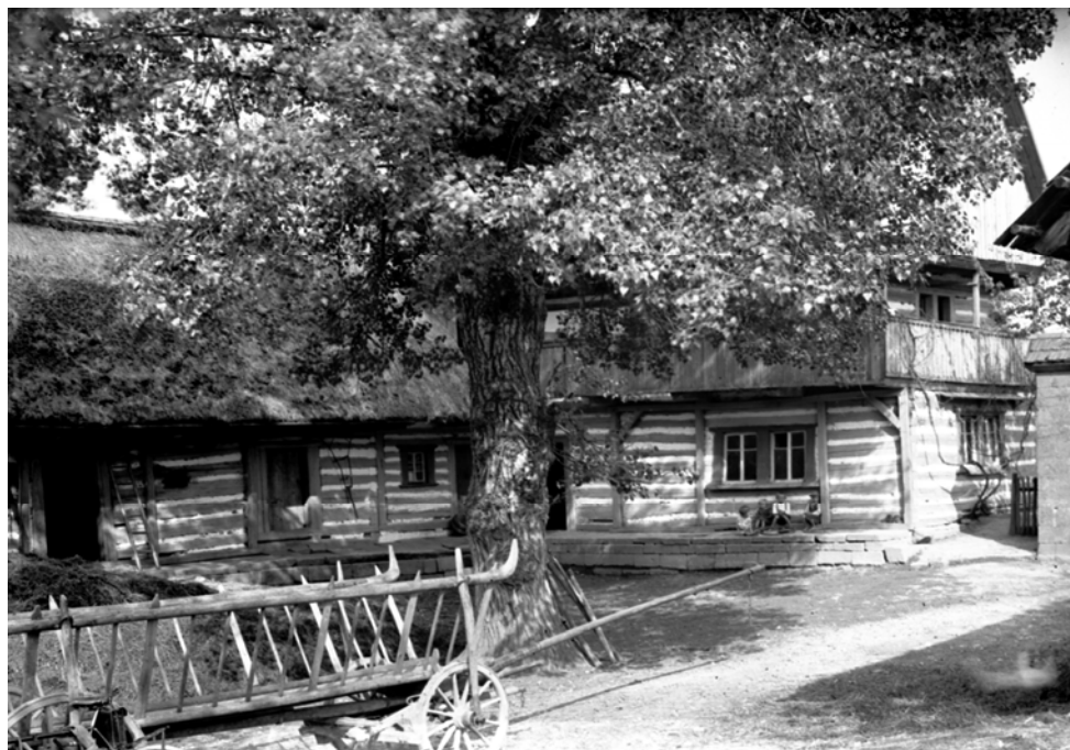
Stéblovce ( Jičín ). Nádvoří usedlosti čp. 5