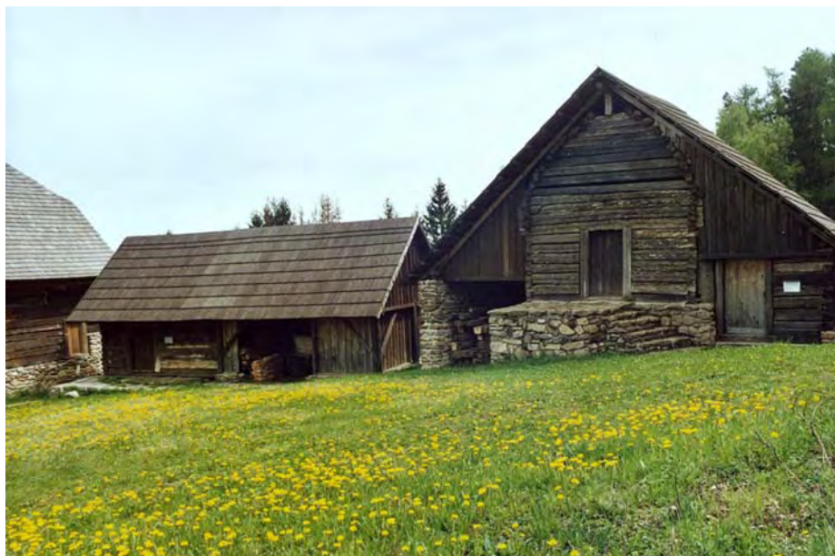
Komora s kolnou od čp. 9 z Měčina a sýpka od čp. 6 z Petrovic u Měčina. Foto R. Tykal, 2004.