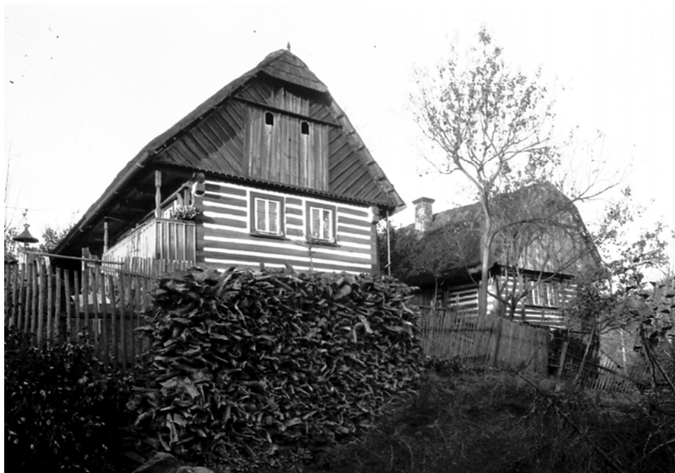
Ktová ( Semily ). Chalupy. Foto Petr Matoušek, 1920–1925