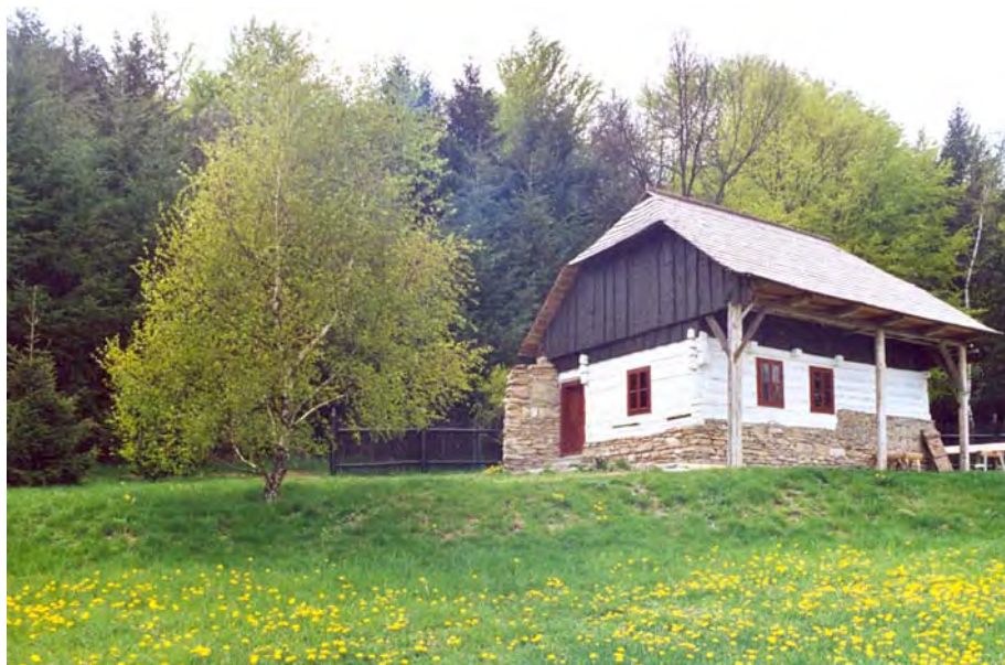
Chalupa čp. 39 z Čachrova. Foto R. Tykal, 2004.