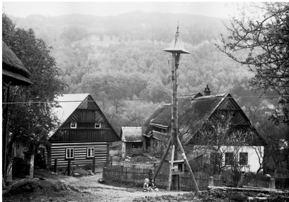
Loužek u Malé Skály ( Semily ). Chalupy čp. 2 a 3 se zvoničkou.